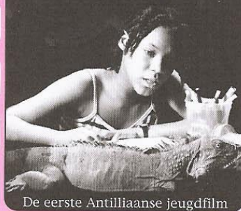
De eerste Antilliaanse jeugdfilm